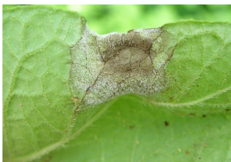
Weisser Pilzrasen von Kraut- und Knollenfäule auf der Unterseite vom Blatt