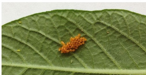
Eier des Kartoffelkäfers