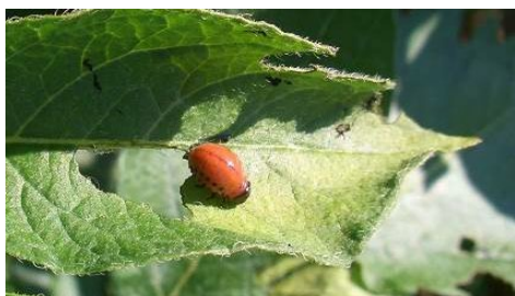
Larve des Kartoffelkäfers