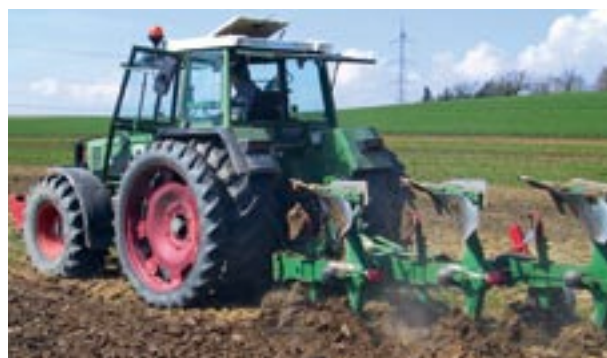
Abb. 13 Einsatz des On-land-Pfluges.