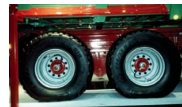
Abb. 9 Anhänger mit reduziertem Pneuinndruck für Feldeinsatz.

Bei welchen Geräten und Maschinen sollten Reifendruckregelanlagen zum Standard gehören?