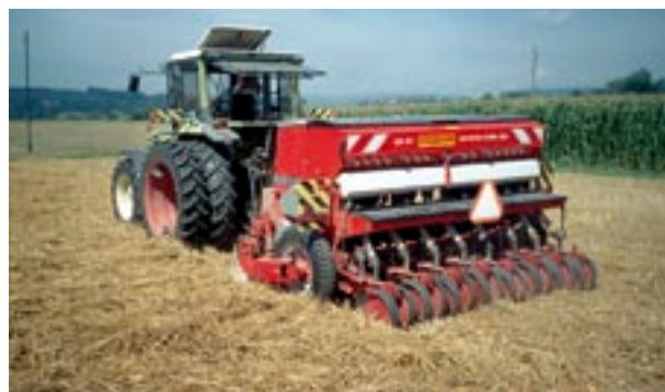
Abb. 11 Direktsaat.

Das Vermeiden von Verdichtungen liegt im Eigeninteresse jedes Landwirts, um einerseits seine Produktionsgrundlage «Boden» zu erhalten und andererseits mit Verzicht von Lockerungseinsätzen zur Behebung von Gefügeschäden Kosten zu sparen.