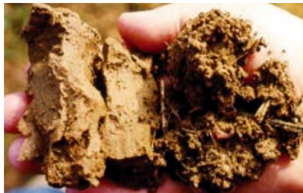
Abb. 2 Vergleich von verdichtetem (links) und lockerem Boden (rechts).