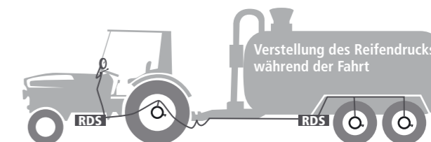
Abb. 8 Regeldrucksysteme schaffen Abhilfe! Kompromiss zwischen Feld- und Strassenfahrten.

All diese Vorteile dürfen nicht darüber hinwegtäuschen, dass die Absenkung des Reifendruckes auch gewisse Grenzen hat. Z. B. bei Strassenfahrten nimmt der Verschleiss und die Gefahr der Überhitzung der Reifen mit sinkendem Innendruck stark zu. Hier können Regeldrucksysteme Abhilfe schaffen.