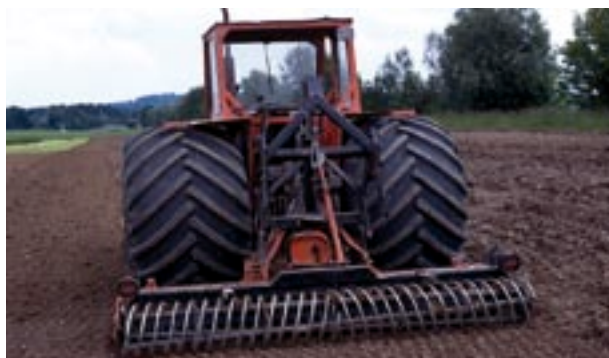
Abb. 10 Grossvolumige Reifen.