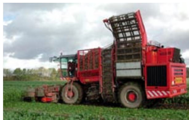
Abb. 5 Schwere Erntemaschinen erhöhen die Schlagkraft, aber auch die Gefahr der Unterbodenverdichtung.

Heute werden für alle Ackerkulturen gezogene und selbstfahrende Vollernter eingesetzt. Sie verfügen über grosse Bunker oder Tanks. Ihr Gesamtgewicht ist durchaus mit demjenigen von grossen Baumaschinen vergleichbar und kann schwerwiegende Unterbodenverdichtungen verursachen.