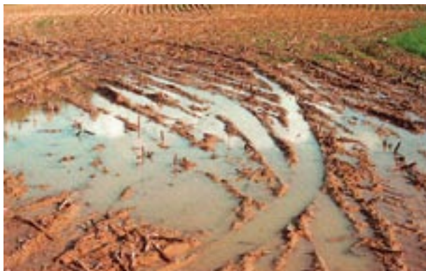
Abb. 1 Stehendes Wasser: eine Folge von Bodenverdichtung.