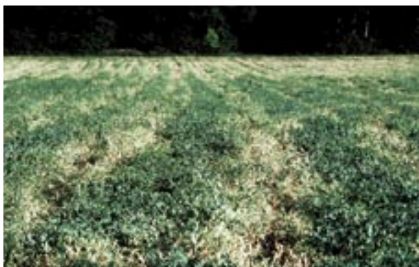
Abb. 3 Ungleichmässiger Erbsenbestand aufgrund von Bodenverdichtung.