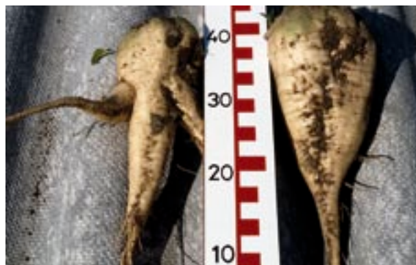
Abb. 4 Beinigkeitsunterschied bei der Zuckerrübe bei verdichtetem Boden (links).