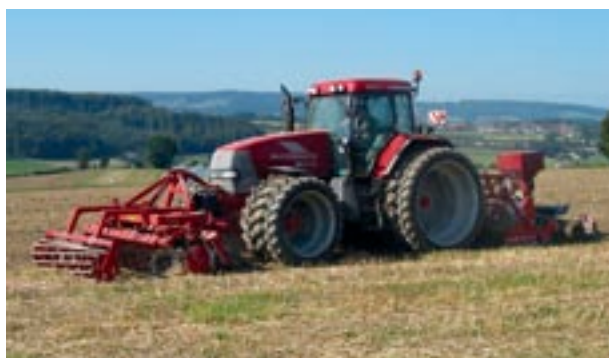
Abb. 12 Einsatz von Mehrfachbereitung und Mulchsaat.