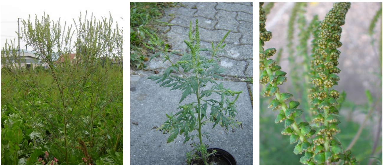
Unscheinbares Aussehen der Ambrosia. Das Bild rechts zeigt den männlichen Blütenstand mit den hoch allergenen Pollen.

Ambrosia gehört zur Gruppe der invasiven Neophyten, die einheimische Pflanzen verdrängen. In der Landwirtschaft kann Ambrosia zum Problem in Kulturen werden, die im Frühsommer gesät und erst im Spätsommer/Herbst geerntet werden (z. B. Sonnenblumen, Soja). Zudem ist der Pollen der Ambrosia hoch allergen und kann beim Menschen Allergien bis hin zu Asthma auslösen. Dadurch wird die Pflanze zu einem gesundheitsgefährdenden Problem, das hohe Kosten nach sich ziehen kann. Aus diesem Grund wurde Ambrosia in der Schweiz per 1. Juli 2006 als besonders gefährlicher Schadorganismus eingestuft und gilt als melde- und bekämpfungspflichtig. Mit Inkrafttreten der neuen Pflanzengesundheitsverordnung (PGesV 916.20) am 1. Januar 2020 gilt Ambrosia weiterhin als Quarantäneorganismus. Die Melde- und Bekämpfungspflicht bleibt bis am 31. Dezember 2023 bestehen. Der Kantonale Pflanzenschutzdienst ist zuständig für die Umsetzung der Kontroll- und Bekämpfungsmassnahmen.