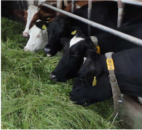
Wiesen- und Weidefutter ist das Hauptfuttermittel von GMF