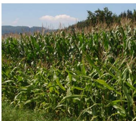
Mais, eine energiereiches Futtermittel

■ Mais ist ein wichtiges Futtermittel in der Tierhaltung. Die energiereiche Pflanze kann vielseitig bei der Fütterung von Milchkühen, Masttieren aber auch Kleinwiederkäuern und Pferden eingesetzt werden. Dank hohen Erträgen zählt Mais zu den kostengünstigsten Futtermitteln.