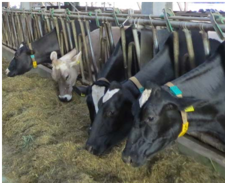
Eine Typische TMR-Ration mit Gras- und Maissilage für Hochleistungskühe

■ Mais als Futtermittel ist in der Milchviehfütterung kaum mehr weg zu denken. Der allgemeine Trend zu steigenden Milchleistungen bedingt eine höhere Nährstoffkonzentration der Futtermittel. Mais erfreut sich daher steigendem Einsatz in der Milchviehfütterung. Am meisten verbreitet ist der Einsatz von Maissilage als Grundfuttermittel.