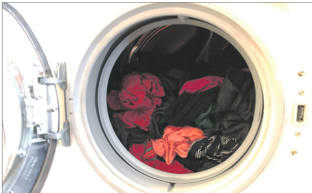
Am nachhaltigsten ist, nur so oft wie nötig zu waschen und die Trommel immer bis maximal eine Handbreite unter den Trommelrand zu füllen.