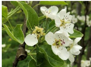
Fred (BBCH 65-67)