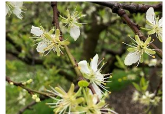
Fellenberg (BBCH 69)