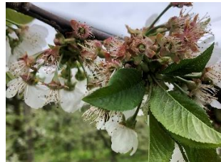
Swett Lorenz (BBCH 67)