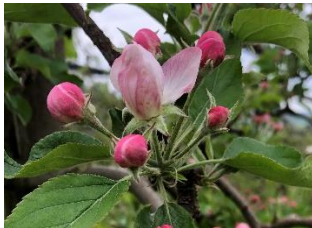
Gala (BBCH 59-61)

Die Behandlungsempfehlungen beziehen sich auf die phänologischen Stadien kurz vor Blühbeginn.