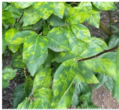
Kreisrunde Symptome Sharkavirus