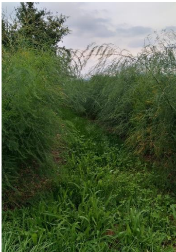
Oben: Biospargel-Feld, unten konv. Spargelfeld mit Begrünung