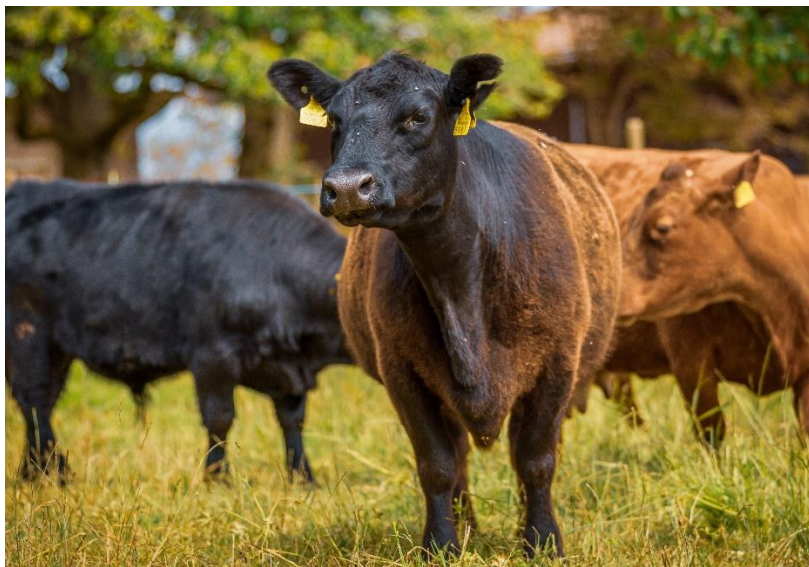
Stammkuh Oldtown Glory

Der Swiss Lowline Rassenclub ist eine aktive und unterstützende Gemeinschaft für alle Liebhaber und Züchter dieser einzigartigen Rinderrasse. Ob Sie bereits Lowline Rinder halten oder sich für die Rasse interessieren – wir heissen neue Mitglieder herzlich willkommen!