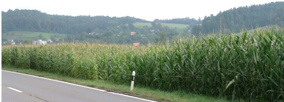
Mais 2023 mit vielen Gesichtern: Die Bodenunterschiede lassen grüssen...