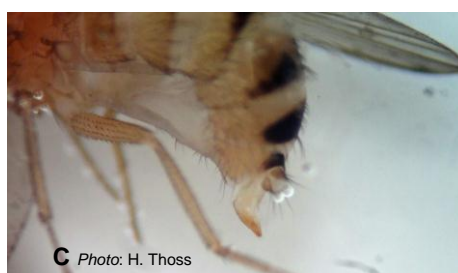
C Photo: H. Thoss