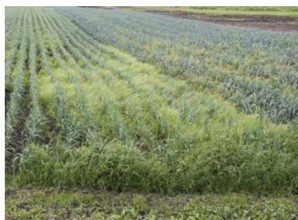
Erdmandelgras in Lauch.