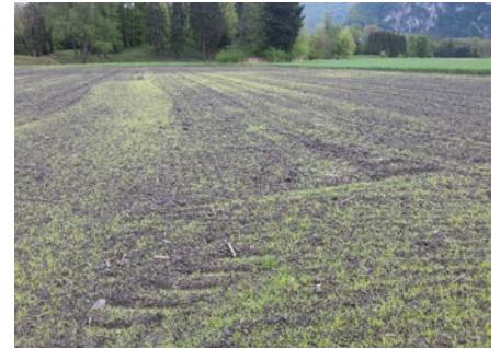
Im Frühjahr die Keimung fördern, um die jungen Pflanzen (2-5-Blatt-Stadium) vor der Knöllchenbildung mechanisch und chemisch zerstören zu können.