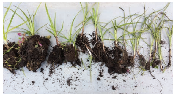
Trennen der Triebe von weissen Rhizomen und Knöllchen (rechts) ist das Ziel der Bodenbearbeitung.

Gut wirksame herbizide Wirkstoffe sind S-metolachlor ( Dual Gold , Sonderbewilligung), eingearbeitet vor der Maissaat sowie Sulfosulfuron ( Monitor mit Netzmittel) im Nachauflauf (NA) im Frühjahr in Winterweizen und Triticale. Der oft erwähnte Wirkstoff Halosulfuron wirkt nicht besser als Dual Gold oder Monitor . Im NA-Mais zeigten Equip Power und Titus + Callisto resp. Calaris sowie Principial + Gardo Gold in Praxisversuchen eine gute Wirkung. Eine Unterblattapplikation von Bentazon in Mais kann das Erdmandelgras zusätzlich schwächen. Glyphosate wirkt nur auf junge Pflanzen befriedigend.