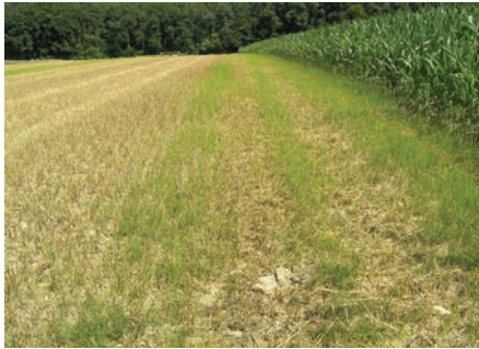
Verschleppung im Feld in Richtung der Bearbeitung.