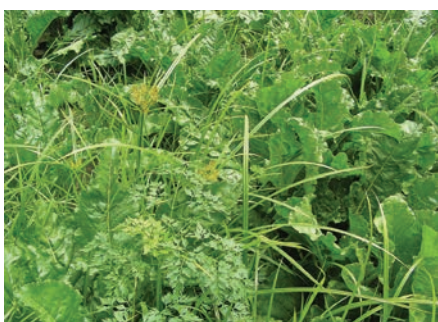
Erdmandelgras in Zuckerrüben