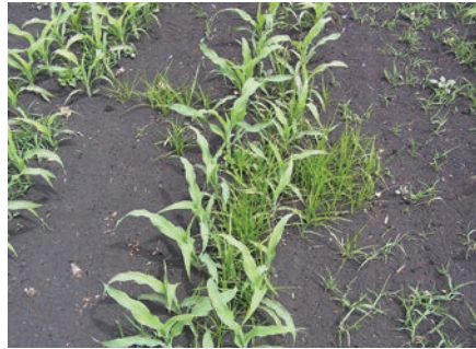
Schadbild in Mais. Knöllchen werden auch von Mäusen verschleppt.