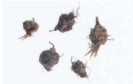
Die rundlichen Knöllchen sind robuste Überwinterungsorgane. Sie werden hauptsächlich durch menschliche Tätigkeiten verschleppt.