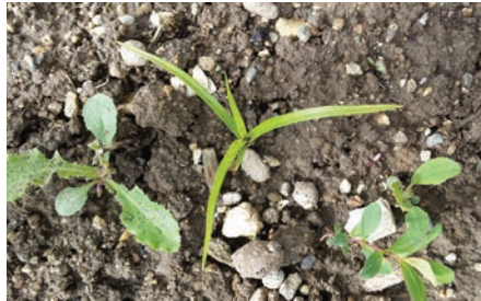
Keimling mit kräftigen Blattspitzen und gelblichen Blättern breitet sich oft als dreizackiger Stern aus.

Das weltweit vorkommende Erdmandelgras breitet sich auf den Feldern im schweizerischen Mittelland meist vegetativ mit rundlichen Wurzelknöllchen rasch aus. Nicht auszuschliessen ist die Vermehrung über Samen. Herbizideinsatz allein reicht nicht aus, denn nur die Kombination von Massnahmen verspricht Bekämpfungserfolg.