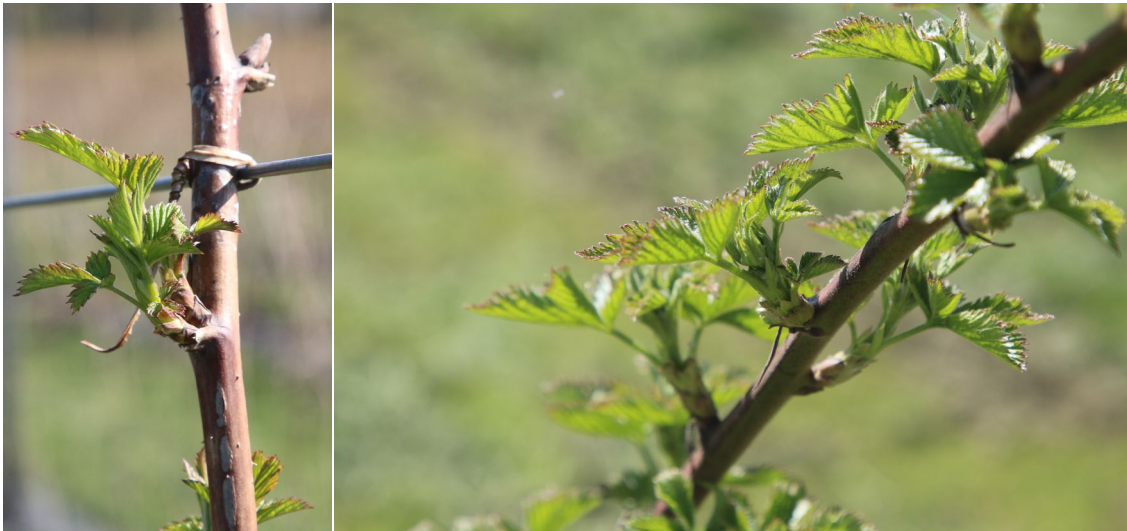
Sommerhimbeeren (linkes Bild: Sorte Meeker) und Brombeeren (rechtes Bild: Sorte Lochness) sind am Austreiben (09.04.2026, kogb)

Bei den Heidelbeeren entwickeln sich Blätter und Blüten, erste Blüten werden sich die kommenden Tage öffnen.