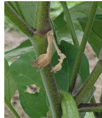
Abbildung 2 Typische Schäden durch Lygus spp.: Verformungen bei Erdbeeren (links, © Virginie Dekumbis Agroscope), Absterben des Triebspitzens bei Gurken (Mitte, © Janique Koller Agroscope) und Blütenabwurf bei Auberginen (rechts, © Christoph Gubler Strickhof)