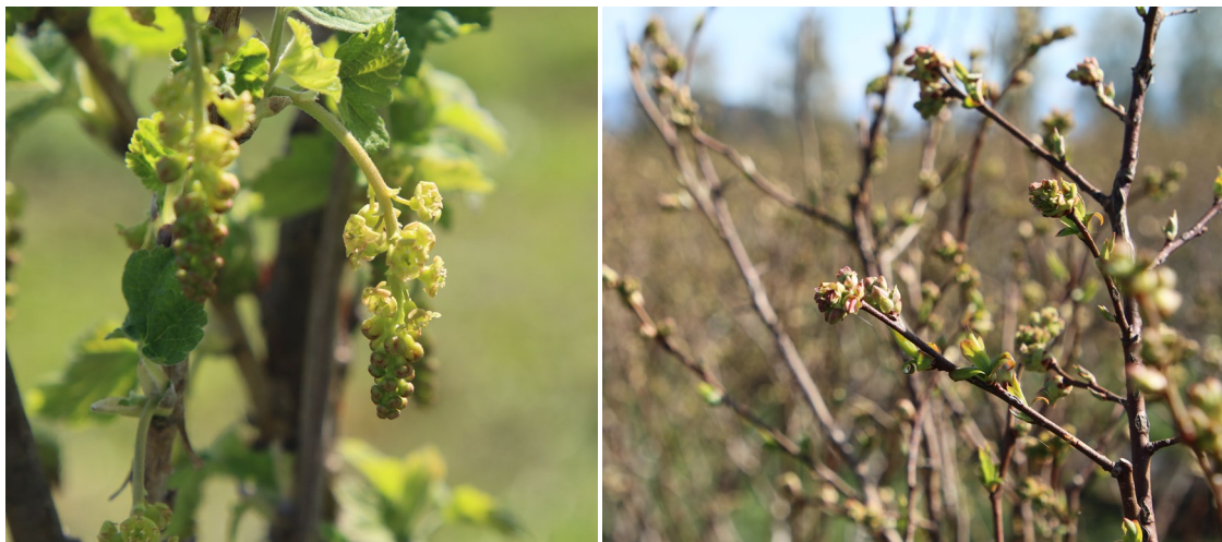
Bei Johannisbeeren beginnt die Blüte - im linken Bild die Sorte Rovada - während bei Heidelbeeren voraussichtlich diese oder kommende Woche die ersten Blüten zu erwarten sind - rechtes Bild Sorte Duke (09.04.2026, kogb)