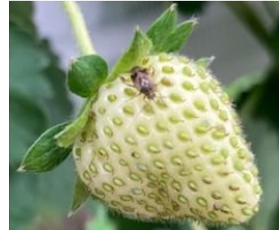
Abbildung 1 Adulte Lygus -Wanze auf einer Erdbeere

Agroscope führt von 2026 bis 2029 das Projekt LYGUS-SAFE durch. Das Ziel ist die Entwicklung praktischer, wirksamer und wirtschaftlich tragbarer Lösungen zur Bekämpfung von Lygus -Wanzen unter möglichst geringem Einsatz synthetischer Produkte.