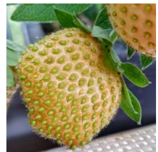
Bronzefärbung durch Thripsbefall (beth)