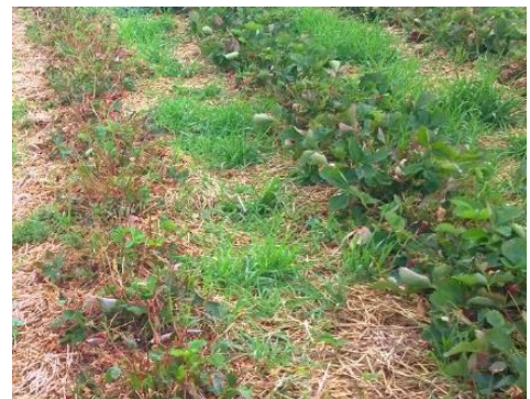
Nach der Ernte ist in den Erdbeeren die Begleitflora rechtzeitig zu bekämpfen, wie Ausfallgetreide und Quecken (thoh)

Besonders in gedeckten Kulturen und im Tunnel beachten.