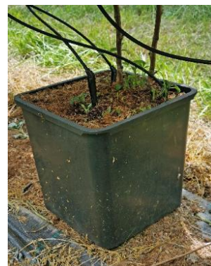
Bodentriebe bei Longcane Kulturen weiterhin konsequent entfernen (thoh)

Düngung (Nachdüngung) bei allen Strauchbeeren beachten. Besonders aber Himbeeren und Brombeeren. Falls noch nicht geschehen, sollte zur Fruchtreife die dritte Düngergabe (Nachdüngung) erfolgen. Fertigation den aktuell stark wechselnden Temperaturen anpassen, d.h. bei Hitze weniger Dünger, längere Spülzeiten und bei kühlen Temperaturen umgekehrt. EC-Werte vom Eingang und Drain regelmässig überwachen.