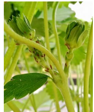
Koloniebildung von Blattläusen auf Erdbeerpflanzen (beth)

Das warme und trockene Wetter begünstigt die Vermehrung von Thripsen, Blattläusen und Spinnmilben . Durch das Abmähen der Ökowiesen in dieser Woche, steigt der Druck durch Thripse zusätzlich an. Gleichzeitig sind Nützlinge wie Marienkäfer, Schwebfliegenlarven und Schlupfwespen bereits in den Kulturen aktiv.