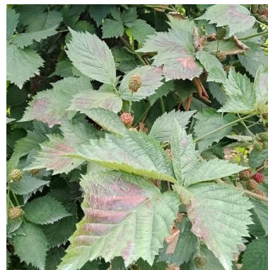
Typische Sonnenbrand Symptome bei Himbeeren (Links und Mitte) und Brombeeren (Rechts) (beth).