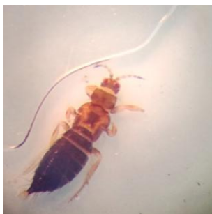
Thrips auf Klebetafel vergrössert (beth)

Thripse leben sehr versteckt. Zur Kontrolle , ob Thripse im Bestand vorhanden sind, können einzelne blaue Klebefallen (Rebell blue) aufgehängt werden oder man nimmt Blüten und klopft diese über einer hellen Fläche (Blatt Papier, Handfläche) aus. Vorhandene Thripse fallen dann heraus und sind somit sichtbar. Sie sind sehr klein, ca. 1,5 mm lang und sehr schmal (siehe Bilder).