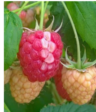
Sonnenbrand, Hitzeschaden auf Himbeeren (thoh, beth)

Auflegen von Hagelnetzen auf den Tunnel zur Schattierung, Schattierfarbe oder Kalk