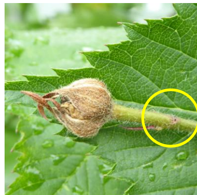
Blütenstecher sind regional sehr aktiv, auch bei Himbeeren und Brombeeren (beth, thoh)

Bei Johannisbeeren auf Blattläuse an den Jungruten achten. Triebspitzen sind verdreht und wachsen nicht mehr weiter. Rechtzeitig behandeln – unter Berücksichtigung des geplanten Erntebeginns, Mittel mit den Wirkstoffen Pirimicarb (Pirimicarb, Pirimor) und Pyrethrine (Pyrethrum