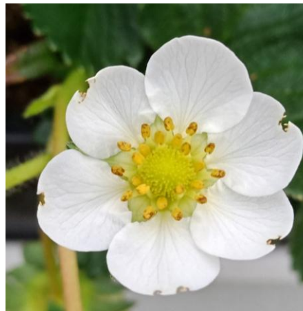
Vereinzelt tritt der Rapsglanzkäfer in Blüten von Erdbeeren und Brombeeren auf. Schäden an den Früchten sind selten, aber nicht auszuschliessen bei starkem Auftreten (FreiS)