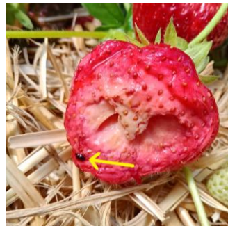
Schäden in Freiland