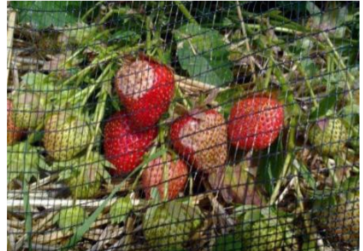
Sonnenbrandschäden auf Erdbeeren, trotz Netz

Besonders gefährdet sind alle Früchte in ungedeckten Kulturen, d.h. ohne Netz- und Regenschutzabdeckungen, sowie die Früchte auf der Süd- und Südwestseite (Bestände mit Reihenrichtung Ost-West) oder auf der Westseite, die Früchte die in der Sonne liegen. Bei Erdbeeren erreicht die Temperatur auf dem Stroh bei Lufttemperatur von 25°C schon bis zu 40°C !