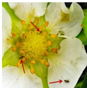
Thripse auf Frucht und in Erdbeerblüte (thoh)