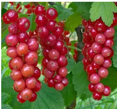
Sonnenbrand auf Stachelbeeren und Johannisbeeren

Sommerschitt verschieben auf kühlere, bewölkte Tage