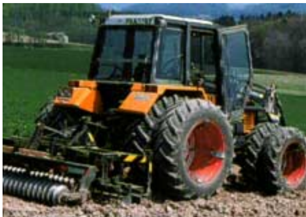
Abb. 8: Doppelbereifung.

Mit Gründüngung, Mist und Kompost den Humusgehalt und damit die Stabilität der Bodenstruktur erhöhen. Bei tiefem Boden-pH unterstützt eine Aufkalkung die Strukturbildung.