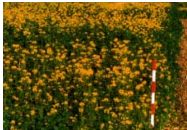
Abb. 9: Blühender Gelbsenf.