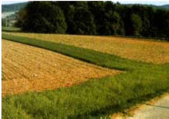
Abb. 7: Wiesenquerstreifen in Mais.

In der Fruchtfolge erosionsanfällige Kulturen durch weniger anfällige ersetzen und offene Bodenphasen möglichst kurz halten.