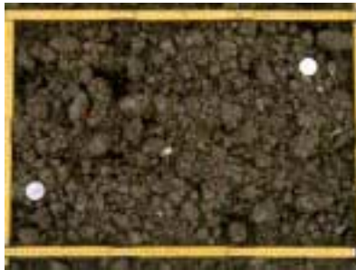
Abb. 10: ideales Saatbeet.

Mulchsaaten in abgefrorene Gründüngungen nutzen die Schutzfunktion der bodenbedeckenden Pflanzenrückstände, um die Ver- schlämmung zu reduzieren.