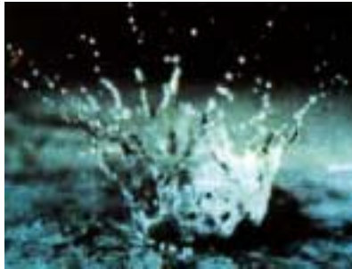
Abb. 2: Aufprall eines Regentropfens auf der Bodenoberfläche.

Zu Erosion kommt es dort, wo der Boden das Wasser nicht mehr aufnehmen kann. Niederschläge, vor allem ergiebige Starkregen (Gewitterregen) in der Zeit mangelnder Bodenbedeckung wirken erosionsfördernd. Die auf den ungeschützten Boden aufprallenden Regentropfen (Abb. 2) zerstören die Bodenstruktur und führen zur Verschlämmung der Bodenoberfläche.