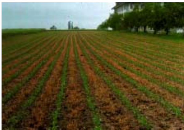
Abb. 13: Streifenfrässaat.