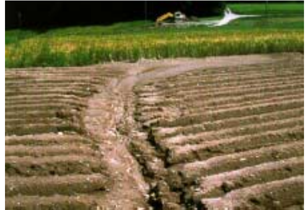
Abb. 6: Grabenförmige Erosion in einem Kartoffelfeld (Verlust bis zu ca. 4 - 7 t Feinerde pro ha und Jahr, abhängig von der Rinnenlänge).