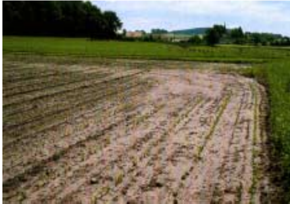
Abb. 5: Flächenerosion in einem Maisfeld (v.a. Verlagerung von Feinerde innerhalb der Parzelle).