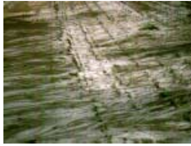
Abb. 3: Verschlammte Böden sind besonders erosionsanfällig.