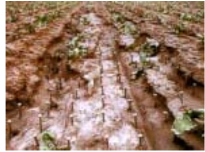
Abb. 4: Mit bodeneben eingeschlagenen Nägeln kann das Ausmass der Erosion sichtbar gemacht werden.

Durch die Verschlammung wird die Wasseraufnahmefähigkeit des Bodens herabgesetzt, der Oberflächenabfluss gesteigert und damit die erodierende Kraft des Wassers verstärkt. Auch bei rasch einsetzender Schneeschmelze kann es zu bedeutendem Bodenabtrag kommen, wenn der wassergesättigte oder noch gefrorene Boden das zusätzlich anfallende Schmelzwasser nicht aufnehmen kann.