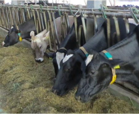
Eine Typische TMR-Ration mit Gras- und Maissilage für Hochleistungskühe

■ Mais als Futtermittel ist in der Milchviehfütterung kaum mehr weg zu denken. Der allgemeine Trend zu steigenden Milchleistungen bedingt eine höhere Nährstoffkonzentration der Futtermittel. Mais erfreut sich daher steigendem Einsatz in der Milchviehfütterung. Am meisten verbreitet ist der Einsatz von Maissilage als Grundfuttermittel.