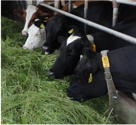
Wiesen- und Weidefutter ist das Hauptfuttermittel von GMF