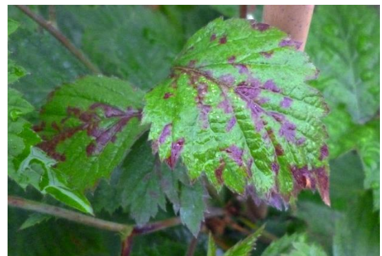
Falscher Mehltau (Peronospora) Brombeere

Zudem ist das aktuelle Wetter ideal für die Ausbreitung von Falschem Mehltau bei Brombeeren. Bestände kontrollieren auf Früchte, die hart und klein bleiben, statt zu reifen, oder auf rötliche Flecken auf den Blättern (s. Bild). Befallene Pflanzenteile entfernen. Die Fungizide dagegen sind wegen der Wartefristen erst wieder nach der Ernte einsetzbar.