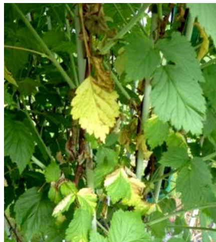
Bild oben: Blattfall Himbeere, Laterale innen Bild unten: Magnesiummangel auf Himbeere- blatt Rutenbasis, Neurute

Magnesiummangel bei Himbeeren beachten (=Chlorosen auf älteren Blättern, untere Blätter der Jungruten, im Inneren der Rute bei Tragruten). Sorte Polka ist besonders anfällig. Zur Behandlung evtl. Ammoniumnitrat + Bittersalz über Bewässerung oder angiesen. Übers Blatt kann auch Fertileader (Magnum oder Magical) oder Hydromag von Yara (mit Fungiziden mischbar) ausgebracht