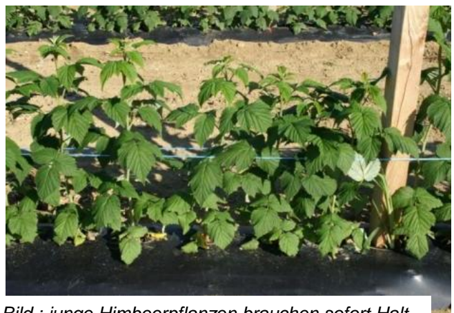
Bild : junge Himbeerpflanzen brauchen sofort Halt, um zügig und aufrecht in die Höhe zu wachsen

Herbst-Himbeeren: seitliche Ruten entfernen. Niedrige Ruten mit vorzeitiger Blüte beachten und eventuell entfernen, da zum Teil schon reife Früchte vorhanden.