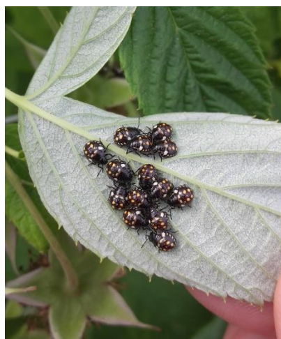
Bilder: links eventuell Nymphen der Marmorierten Baumwanze ( Halyomorpha halys ) auf Erdbeere und links junge Wanzen auf einem Himbeerblatt (vermutlich Nezara . Grüne Reiswanze)