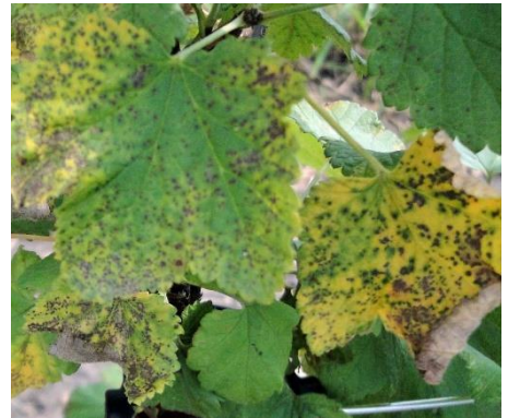
Blattfallkrankheit an Johannisbeere

Bestände, die jetzt in die Reife kommen, sorgfältig auf Befall mit Kirschessigfliege kontrollieren. Es wurde bereits deutlicher KEF-Befall beobachtet. Massnahmen zur Erntehygiene sind der wichtigste Baustein einer erfolgreichen Bekämpfungsstrategie. Siehe Infos zum Thema KEF der Kantonalen Fachstellen oder Agroscope im Internet.