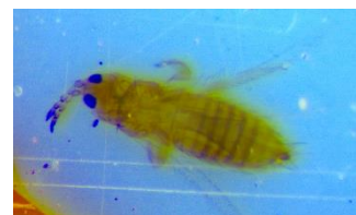
Unten Thrips auf Blautafel vergrössert (C Werdenberg)